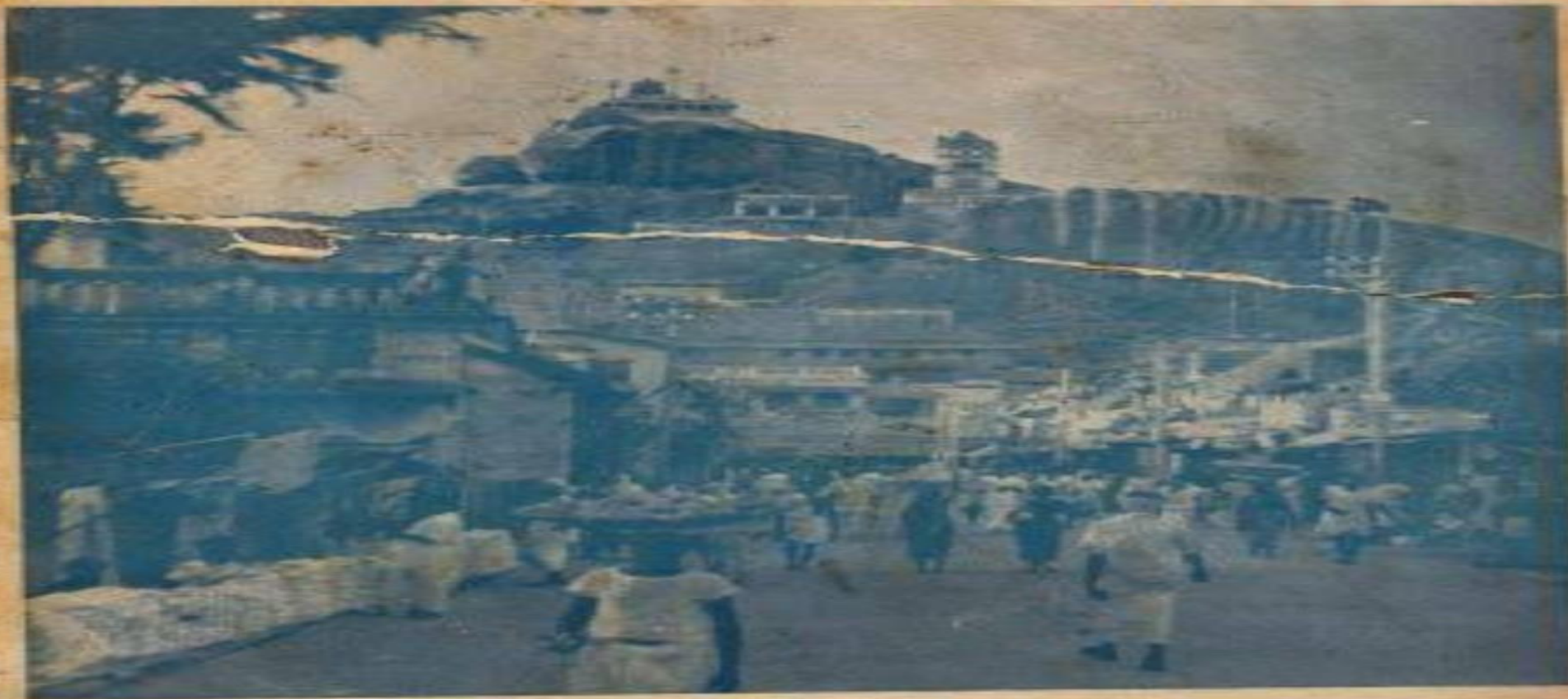
சுவாமித்ரன் கோயிலின் காட்சி